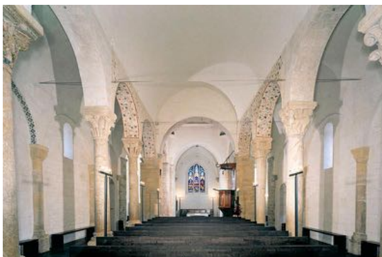
Église Saint-Jean-Baptiste de Grandson du XIV e siècle (Suisse – canton de Vaud)

Date et signature, précédées de la mention « lu et approuvé »