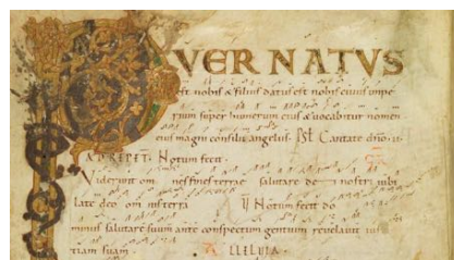
Introit Puer natus est pour la Nativité – ms. de Bamberg

Le fruit récolté du travail sera présenté en public dans des lieux sélectionnés. L'objectif au cœur de cette démarche sera de relier le patrimoine vocal au patrimoine architectural. Le travail sera aussi axé sur l'acoustique et sur la manière de remettre en perspective ces chants par des techniques d'écoute et de résonances en accord avec les lieux.