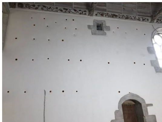
Abbaye Notre-Dame-des-Anges, Landéda (L'Aber Wrac'h)